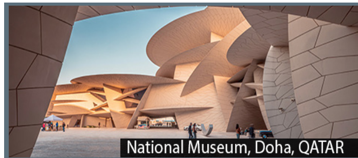
National Museum, Doha, QATAR